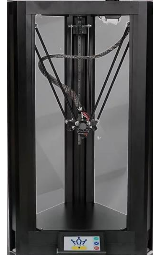
Image quote from "今周刊" Image quote from "祐康老人養護中心" Image quote from "YAHOO商城" Image quote from "美洛克工業"